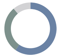
Distribución Renta Fija

■ 44,56% Corporativo ■ 21,81% Gobierno ■ 8,32% High Yield