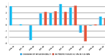
Gráfico rentabilidad semestral de los últimos 5 años